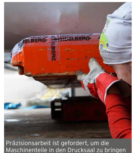
Präzisionsarbeit ist gefordert, um die Maschinenteile in den Drucksaal zu bringen