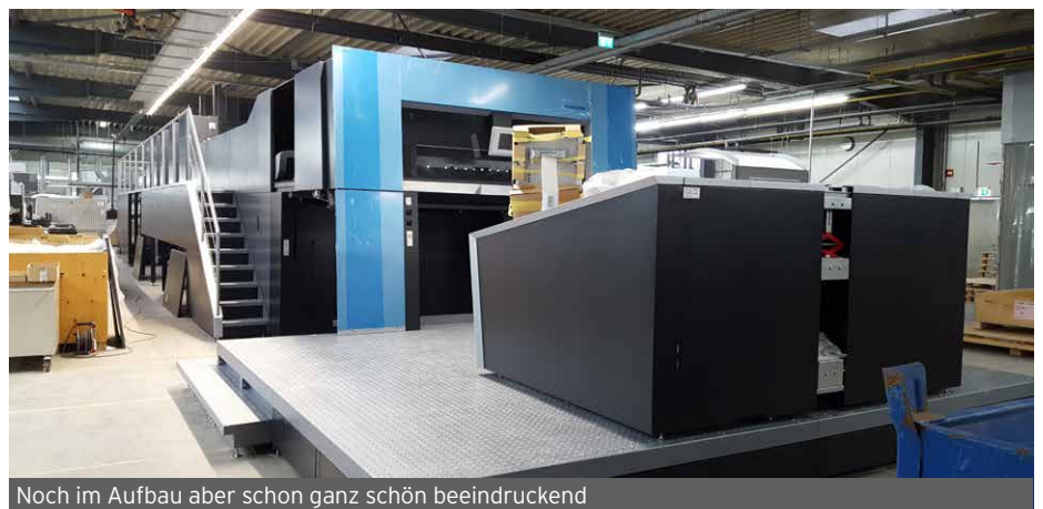
Noch im Aufbau aber schon ganz schön beeindruckend