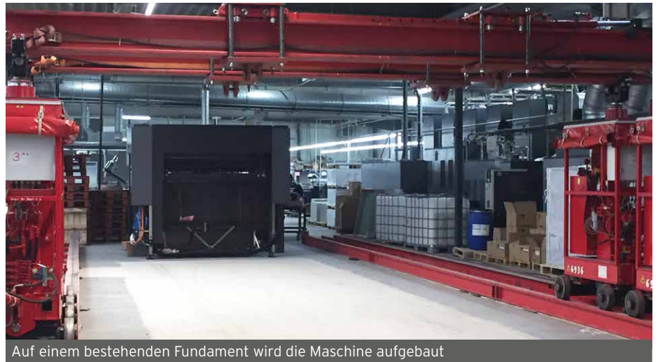
Auf einem bestehenden Fundament wird die Maschine aufgebaut

Neue Druckmaschine XL 162 geht ab März in die Produktion