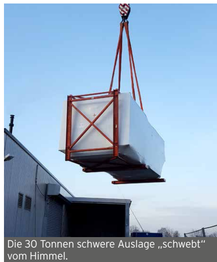
Die 30 Tonnen schwere Auslage „schwebt“ vom Himmel.